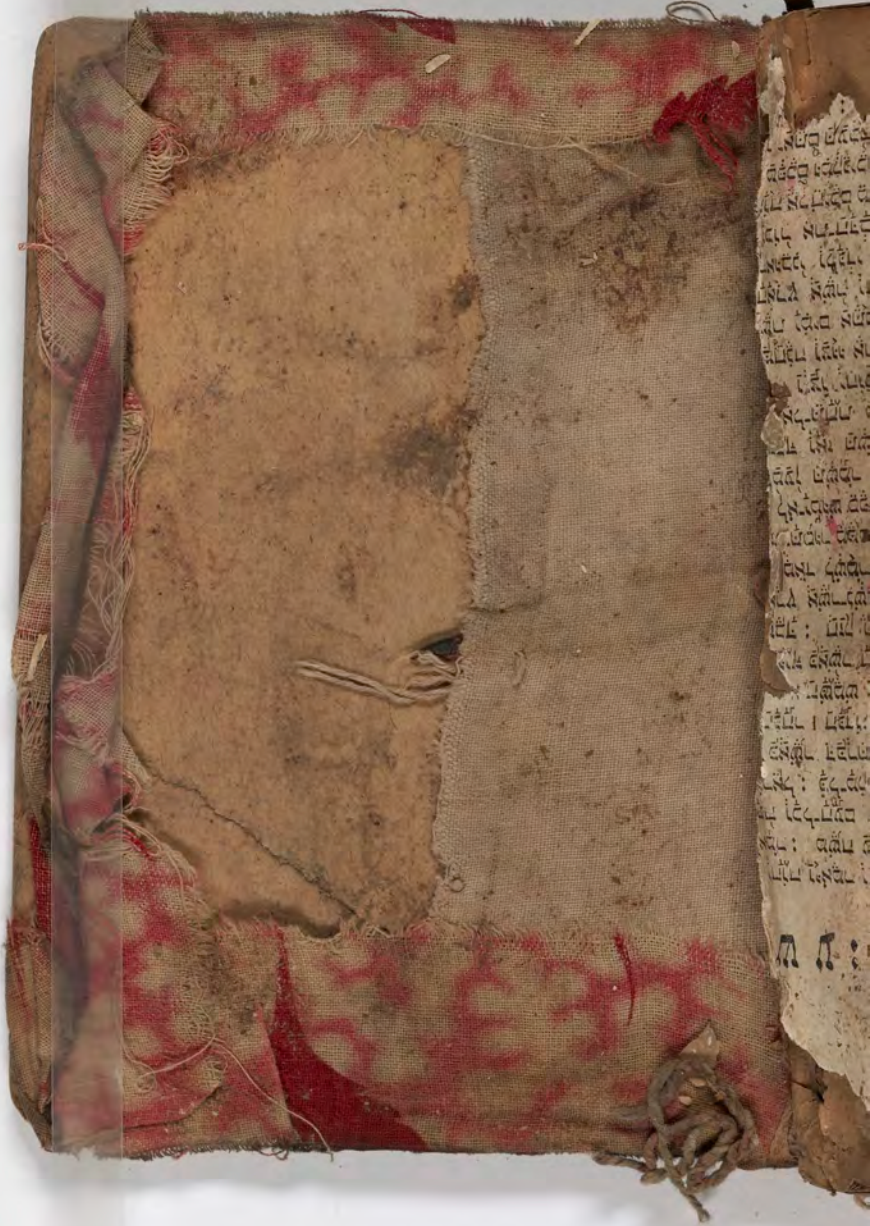
شظية مرئية من كتاب مجلدّ visible fragment from bookbinding