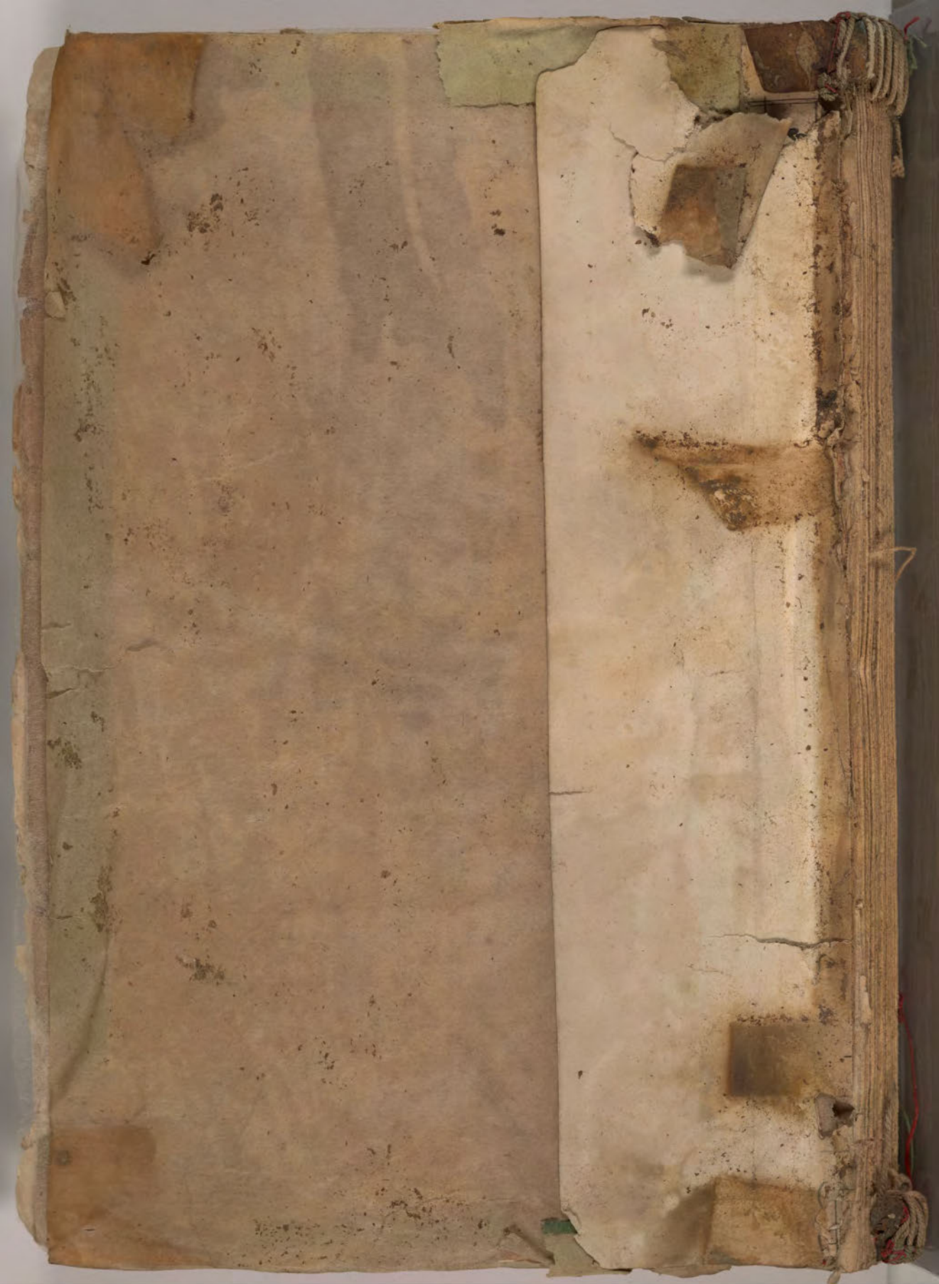
fragment/insert found with book / إدراج وجد(ت) مع كتاب قطعة شظية