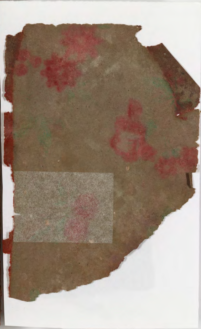
قطعة شظية مرئية من كتاب مجلد visible fragment from bookbinding

re go to say, George, don't call me t like "Hughes" or Mister Hughes breat or Illydd - I don't mind.