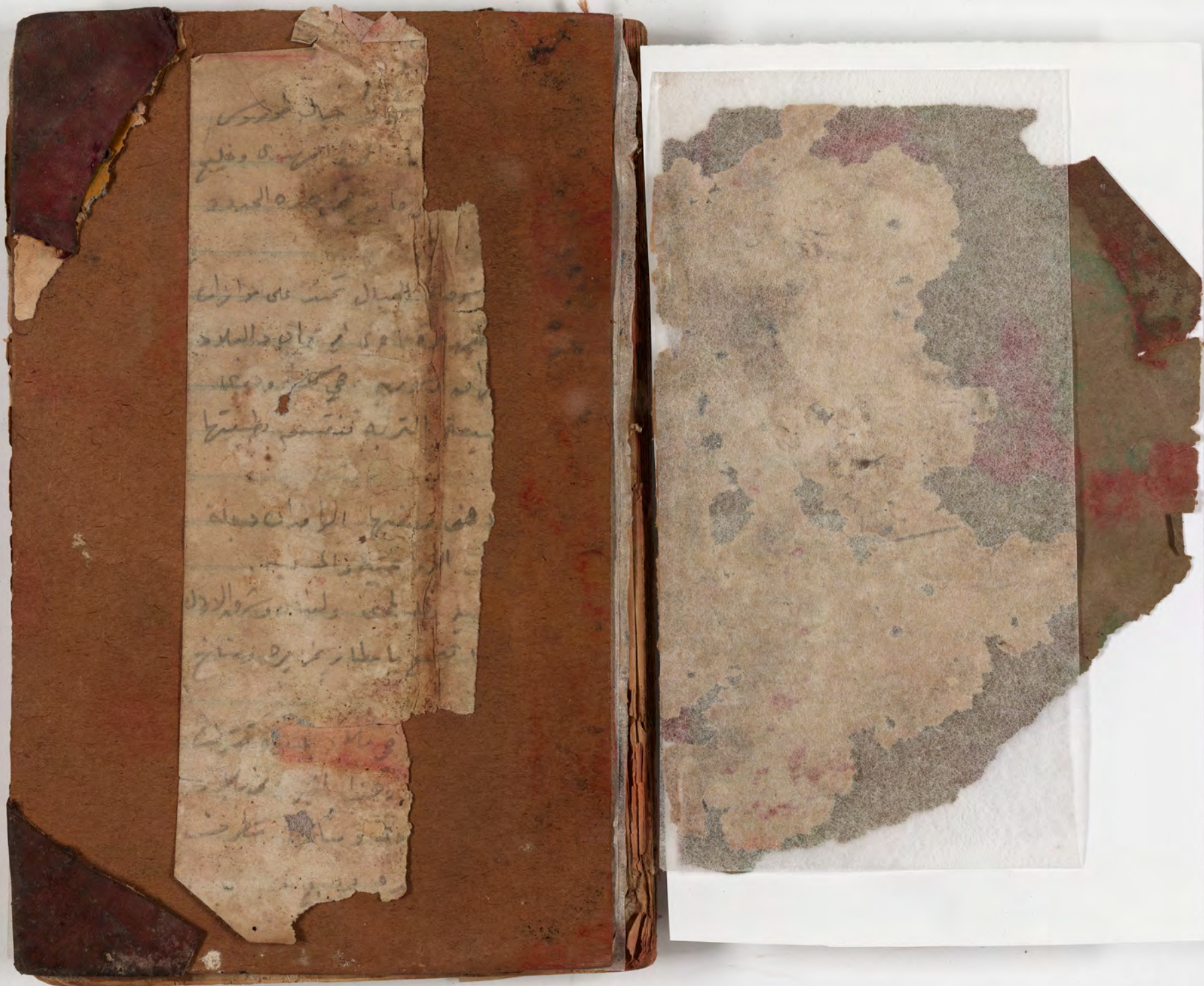
قطعة شظية مرئية من كتاب مجلد visible fragment from bookbinding