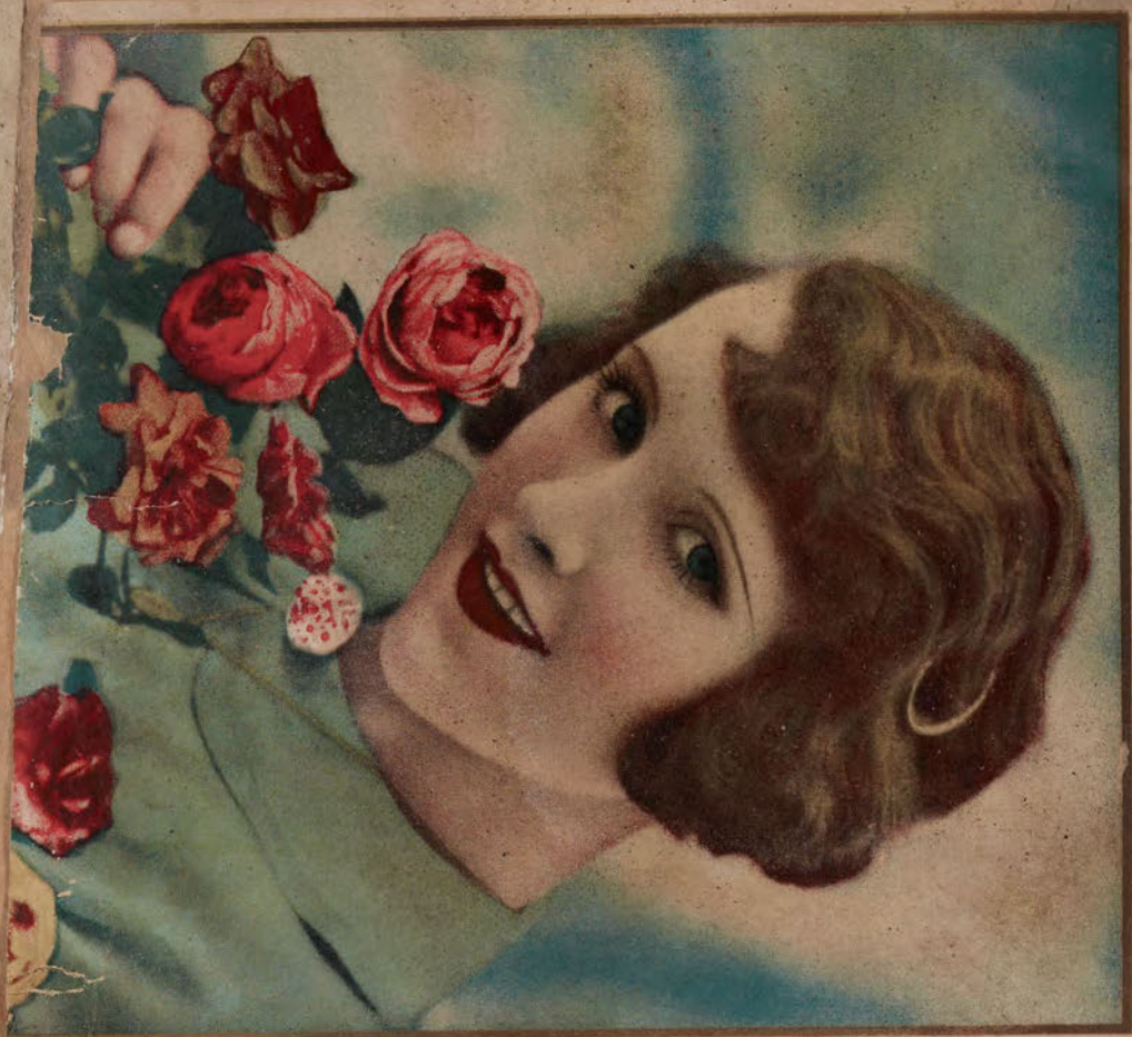
قطعة شظية مرئية من كتاب مجلدّ visible fragment from bookbinding