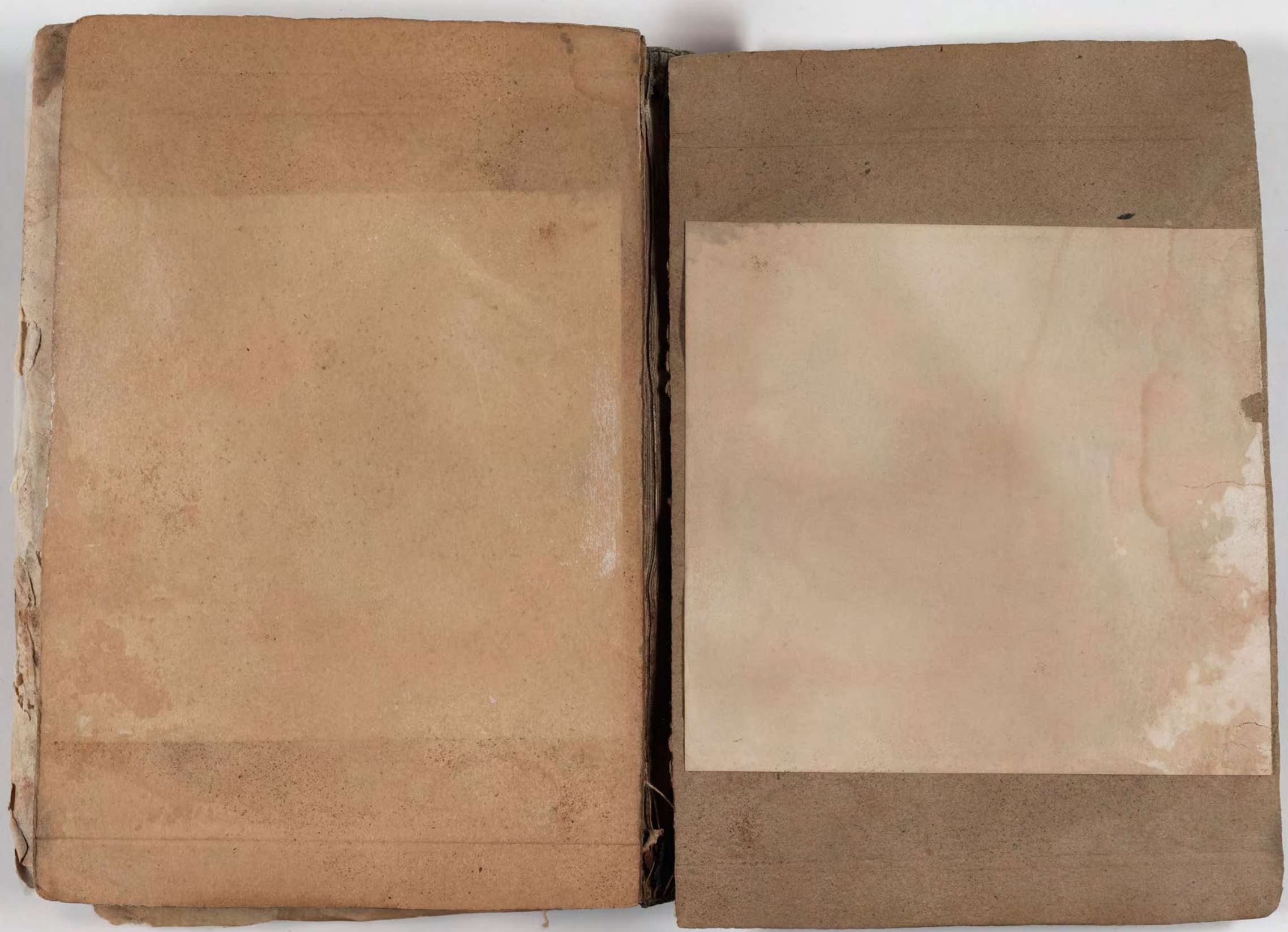
قطعة شظية مرئية من كتاب مجلدّ visible fragment from bookbinding