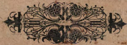
قطعة شظية مرئية من كتاب مجلدّ visible fragment from bookbinding

הגוי קם וינעקת וכוונת וסופרה לו כל המעשה כששם המלך את הכונה מוד הגוי שהם בנו ותיא אשתו ואמר המלך לבעל הספונה הנר לי האמת אהך באם האשה הזאת לידך ואם לא תאמר לי האמת אחתוך את האשך אמר לו אדוני המלך אני שבתיה על שפת הים שהיתה מכבסת בנדרים ופי בפשך אדוני המלך לא נגעתי בה ולא נוקחתי עמה לעולם ועתה עשה ממני כל מה שתראה מני ואמר לו המלך לך לשלום אל ארפך . ויאמר המלך ברוך מאלם שכר טוב איהואו ובהך המסויר הכונה לכעלניה . ועמד המלך עם אשתו וכינו בעושר גדול ואמרו רבותינו ו"ל ומה זה שלא אמר כי קם מורה אקתשטיה לו אביו שילם לו הק"בה כך כל שכן השומר מות הרבה שהקדוש ברוך הוא משלם שכר טוב לאנשים שנאמר ונעשה חסד לאנשים וכו' לך נאמר לא תשא את אס ה' אהך לשוא :