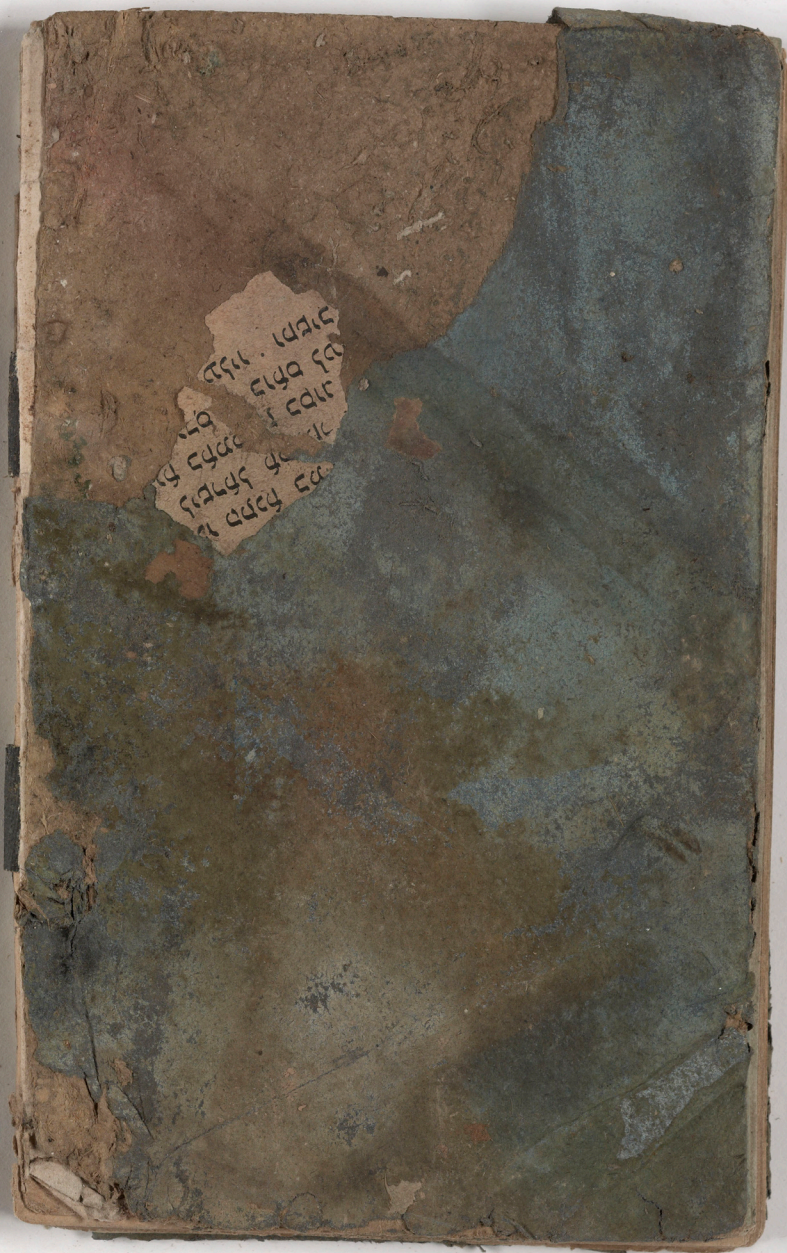
قطعة شظية / إدراج وجد(ت) مع كتاب fragment/insert found with book