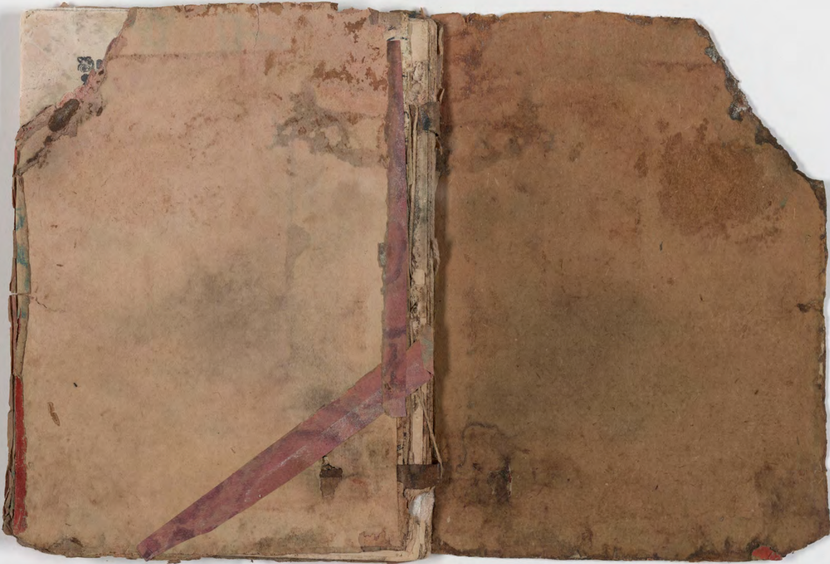
قطعة شظية مرئية من كتاب مجلدّ visible fragment from bookbinding