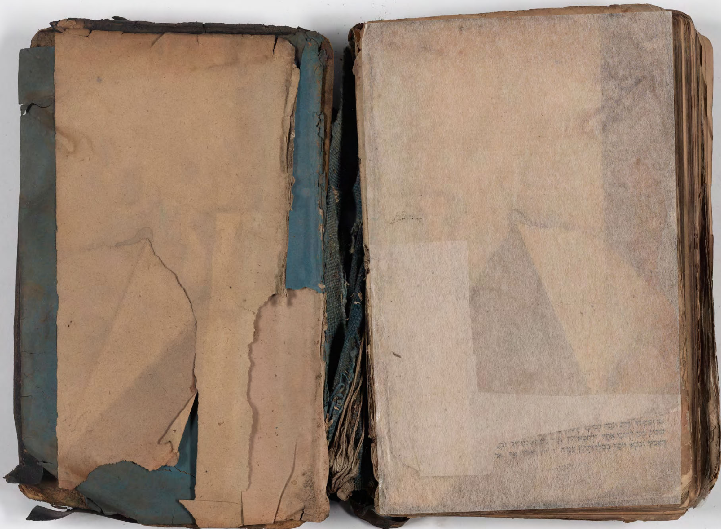
قطعة شظية مرئية من كتاب مجلدٓ visible fragment from bookbinding