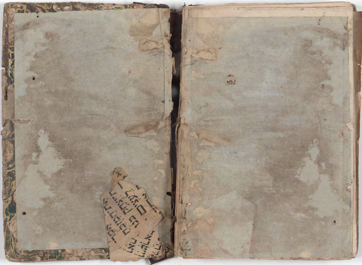
قطعة شظية / إدراج وجد(ت) مع كتاب fragment/insert found with book