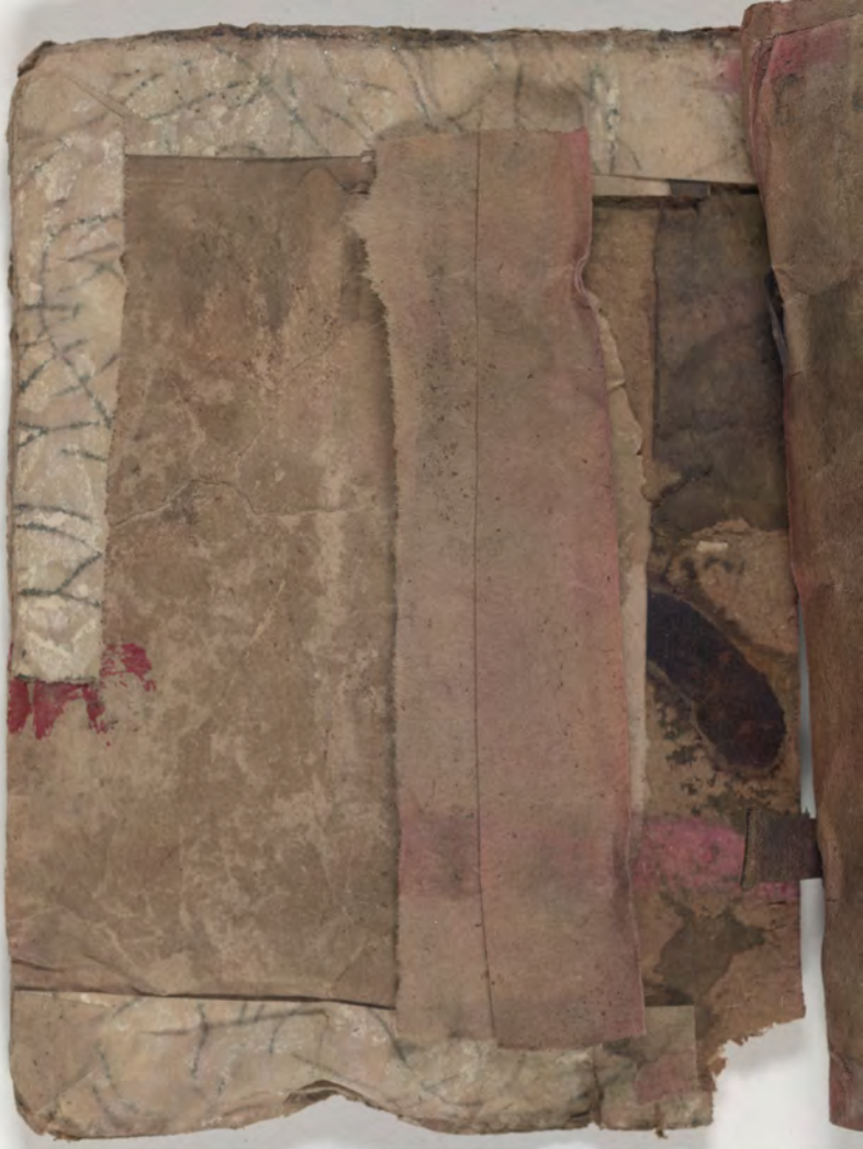
قطعة شظية / إدراج وجد(ت) مع كتاب fragment/insert found with book