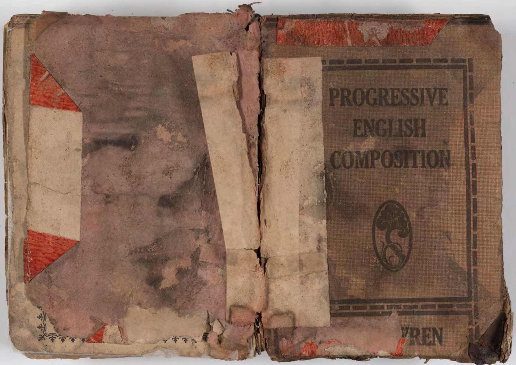
قطعة شظية مرئية من كتاب مجلدّ visible fragment from bookbinding