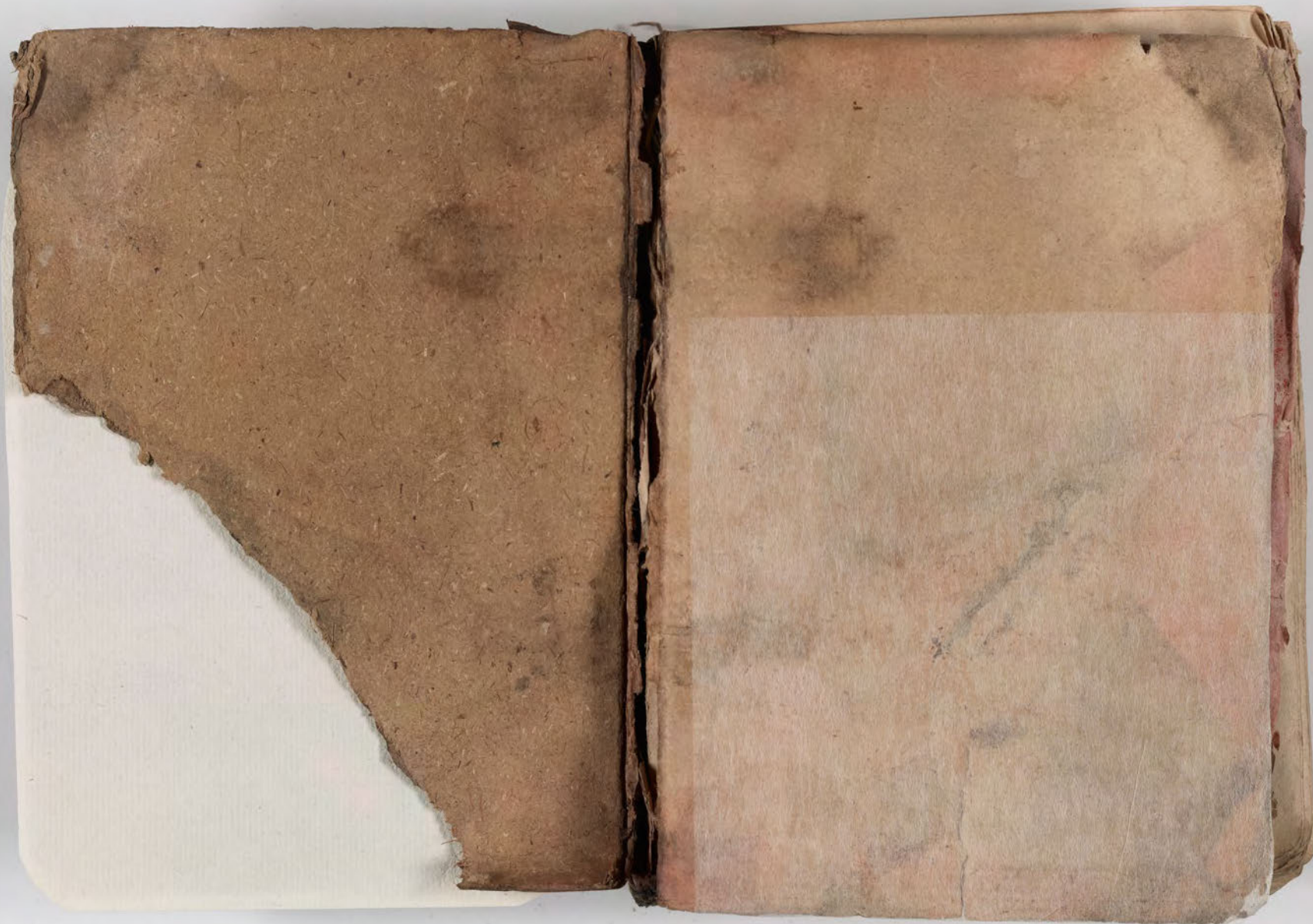
قطعة شظية مرئية من كتاب مجلدّ visible fragment from bookbinding