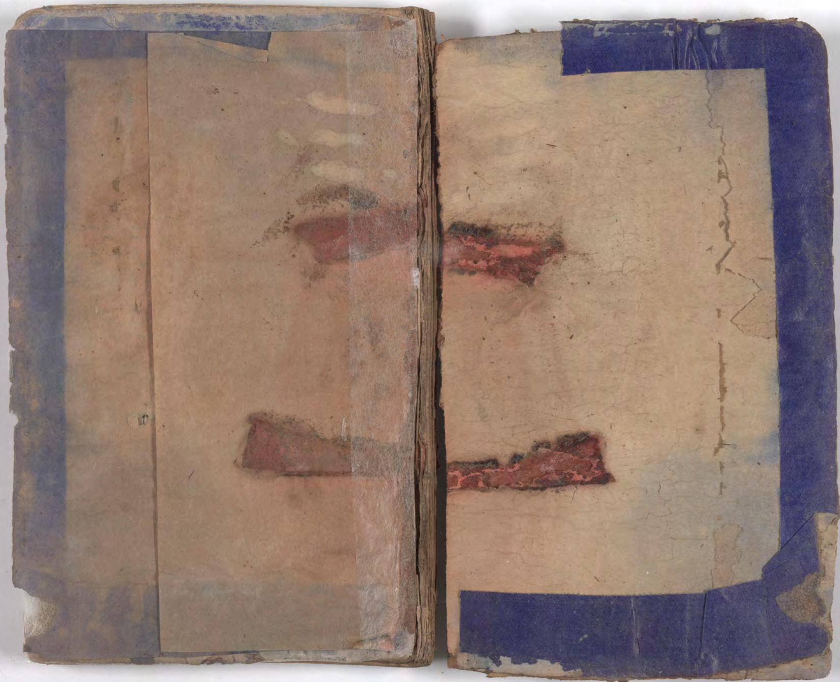
قطعة شظية مرئية من كتاب مجلدّ visible fragment from bookbinding