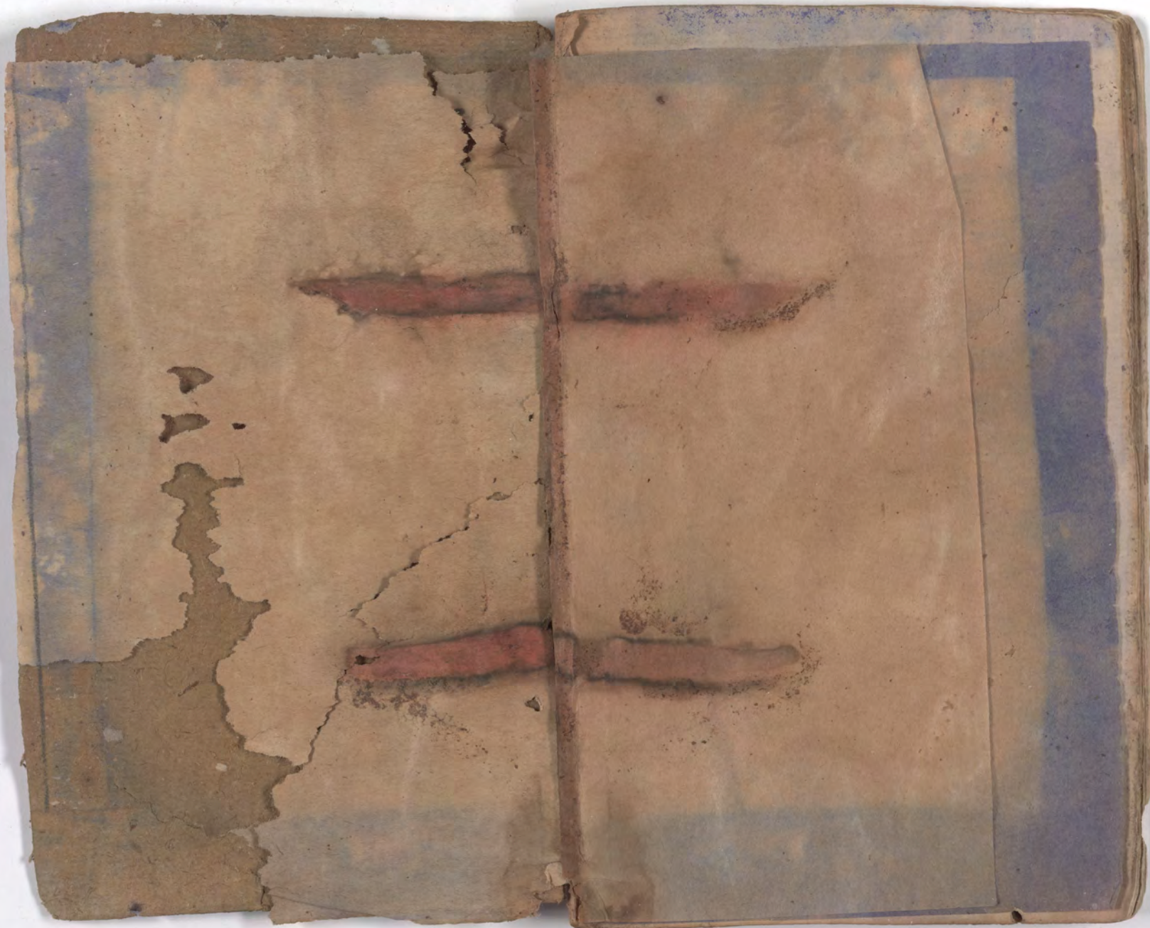
قطعة شظية مرئية من كتاب مجلدّ visible fragment from bookbinding