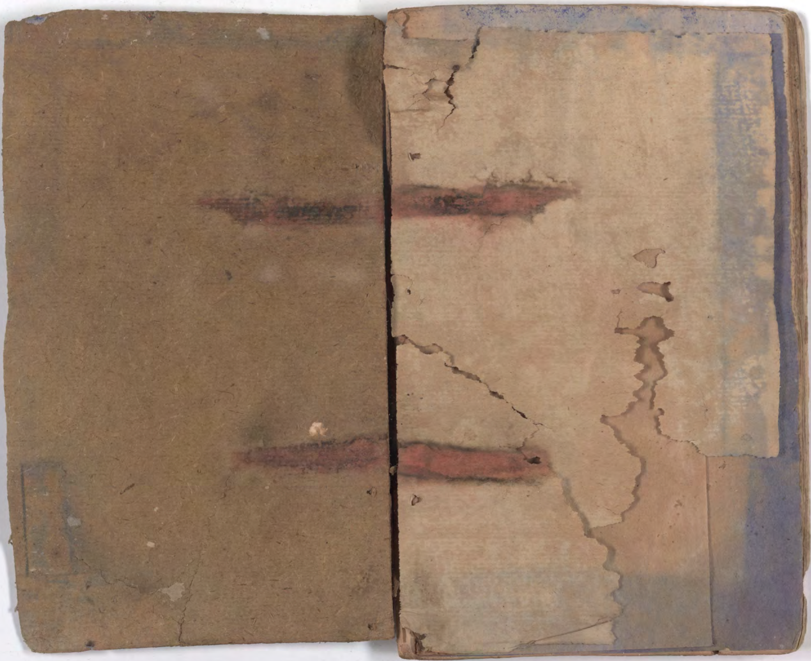
قطعة شظية مرئية من كتاب مجلدّ visible fragment from bookbinding