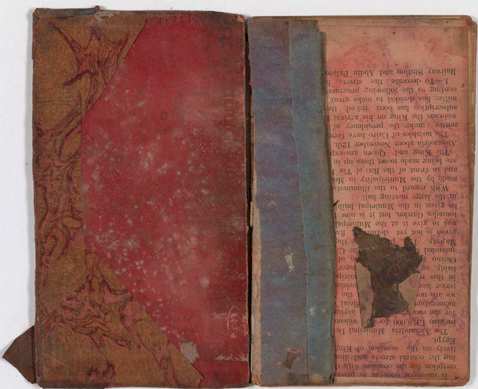
قطعة شظية مرئية من كتاب مجلدًا visible fragment from bookbinding