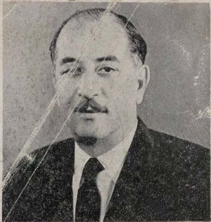
المهيب السيد احمد حسن البكر رئيس الجمهورية العراقية، والقائد العام للقوات المسلحة