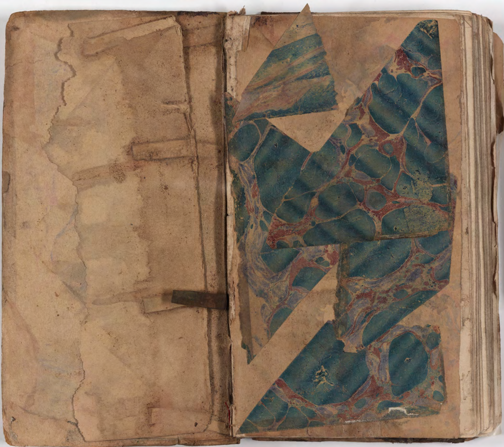
قطعة شظية مرئية من كتاب مجلدّ