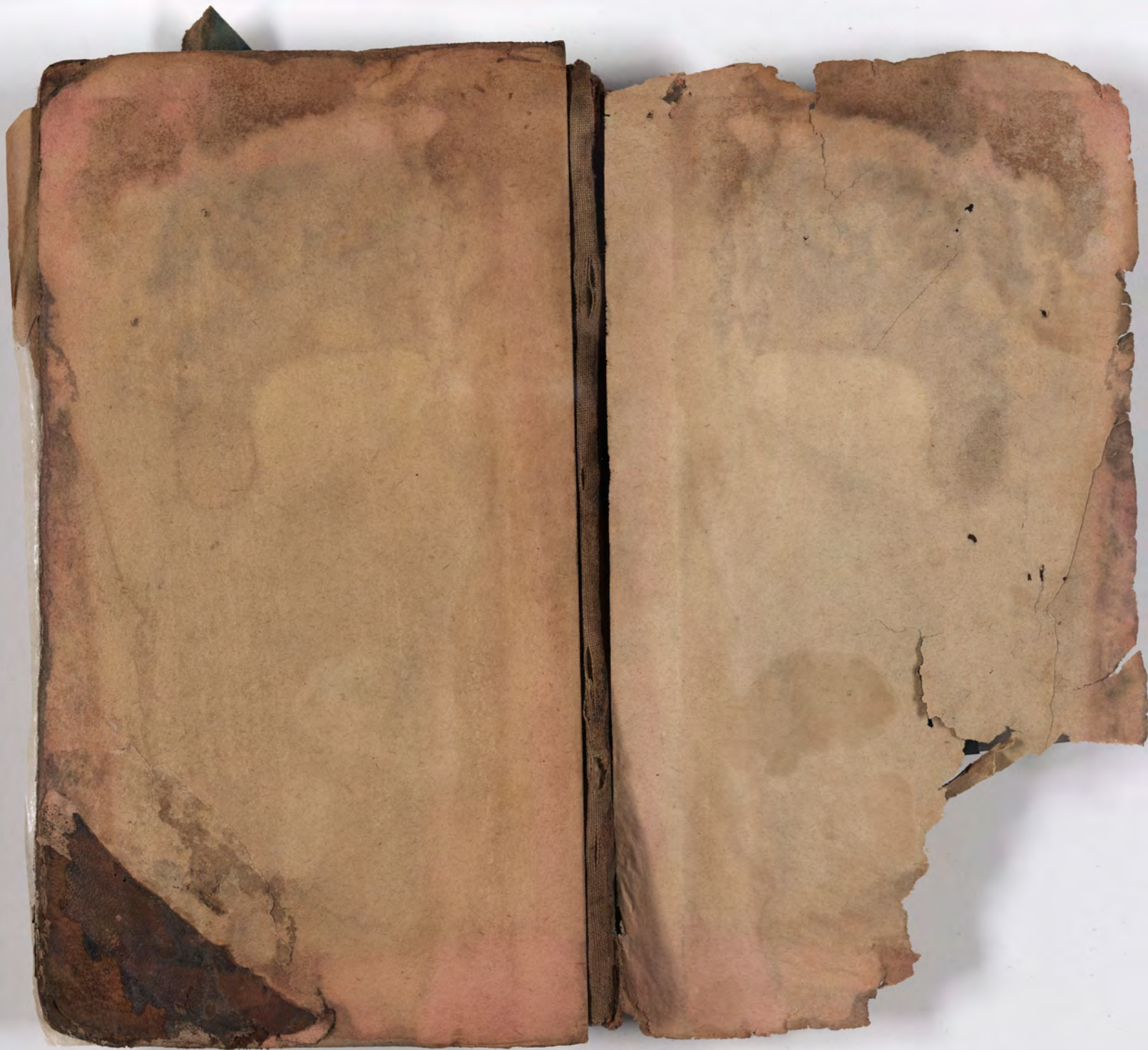
قطعة شظية مرئية من كتاب مجلدّ visible fragment from bookbinding