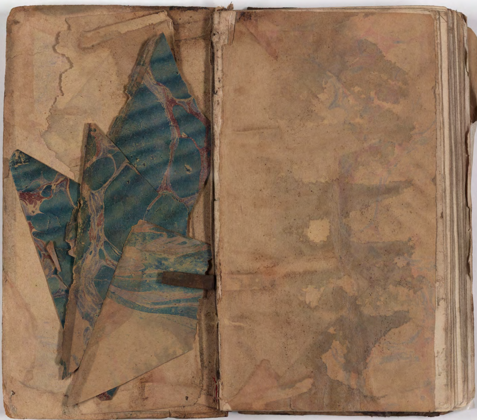
قطعة شظية مرئية من كتاب مجلدّ visible fragment from bookbinding