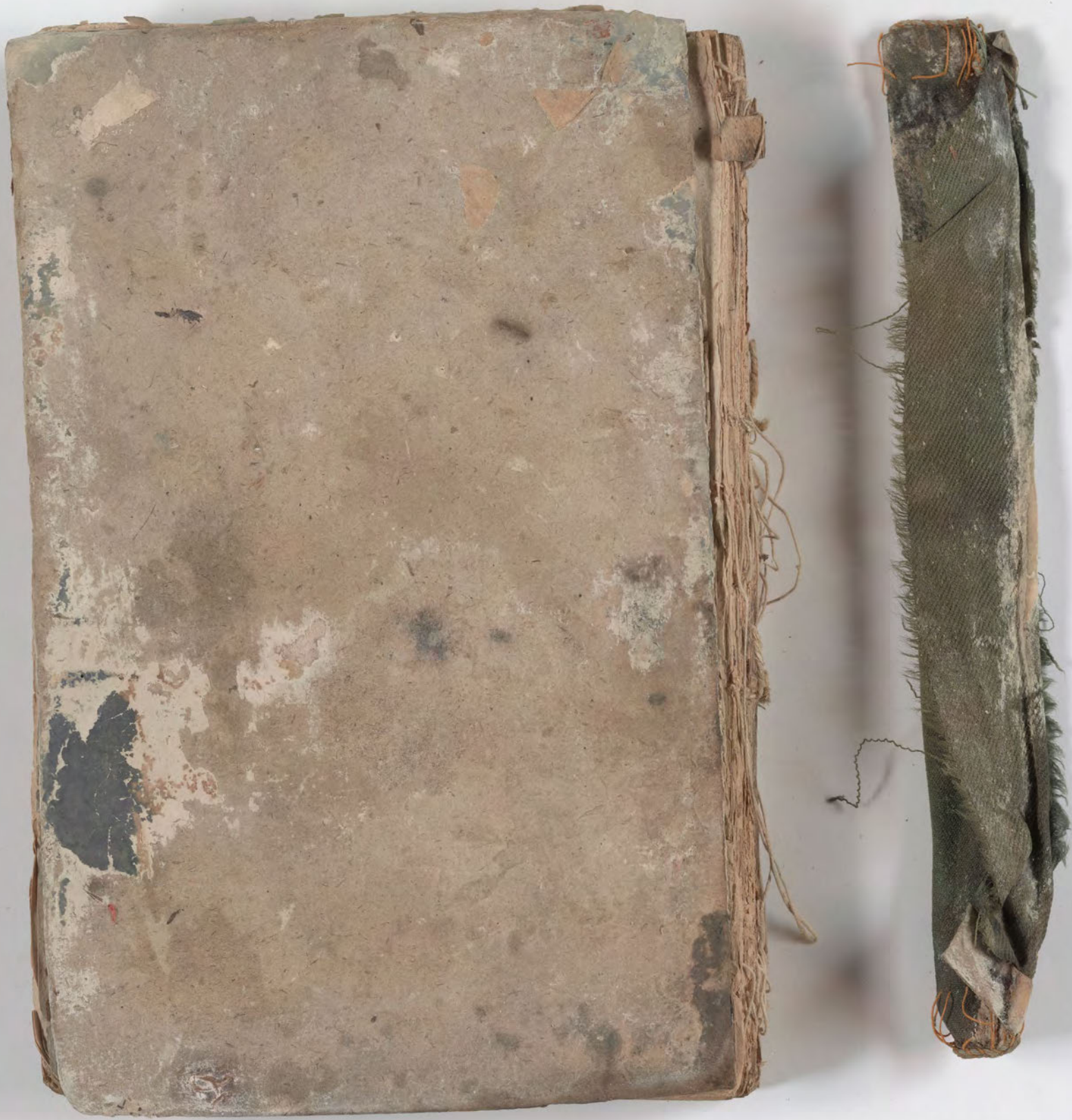
قطعة شظية مرئية من كتاب مجلدّ