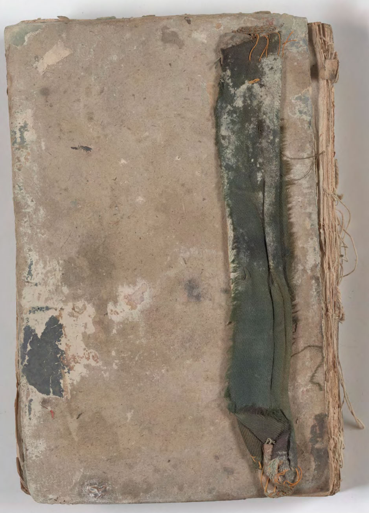
قطعة شظية مرئية من كتاب مجلدّ