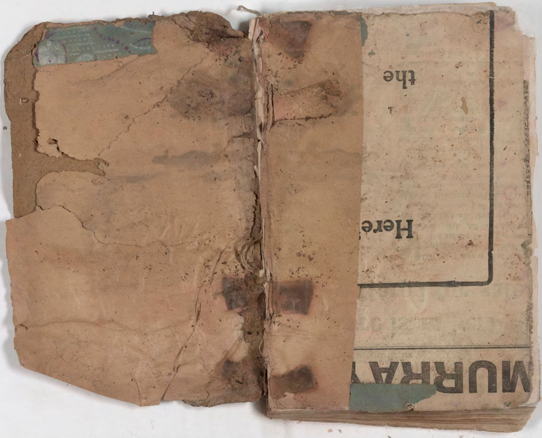
قطعة شظية مرئية من كتاب مجلدّ visible fragment from bookbinding