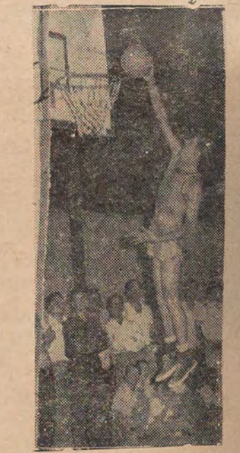
فريق انجته بغداد سواء كان من الناحية الفنية او الادارية

او الضبط . نعم الضبط الذي هو اهم ما يتجلى به كل رياضي يلج باب الرياضة من اوسعها في سبيل تقدمها ورفعة مستواها وليس في