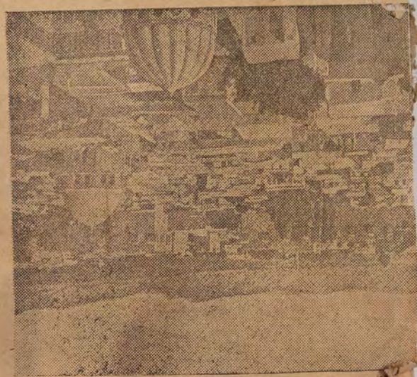
قطعة شظية مرئية من كتاب مجلد visible fragment from bookbinding