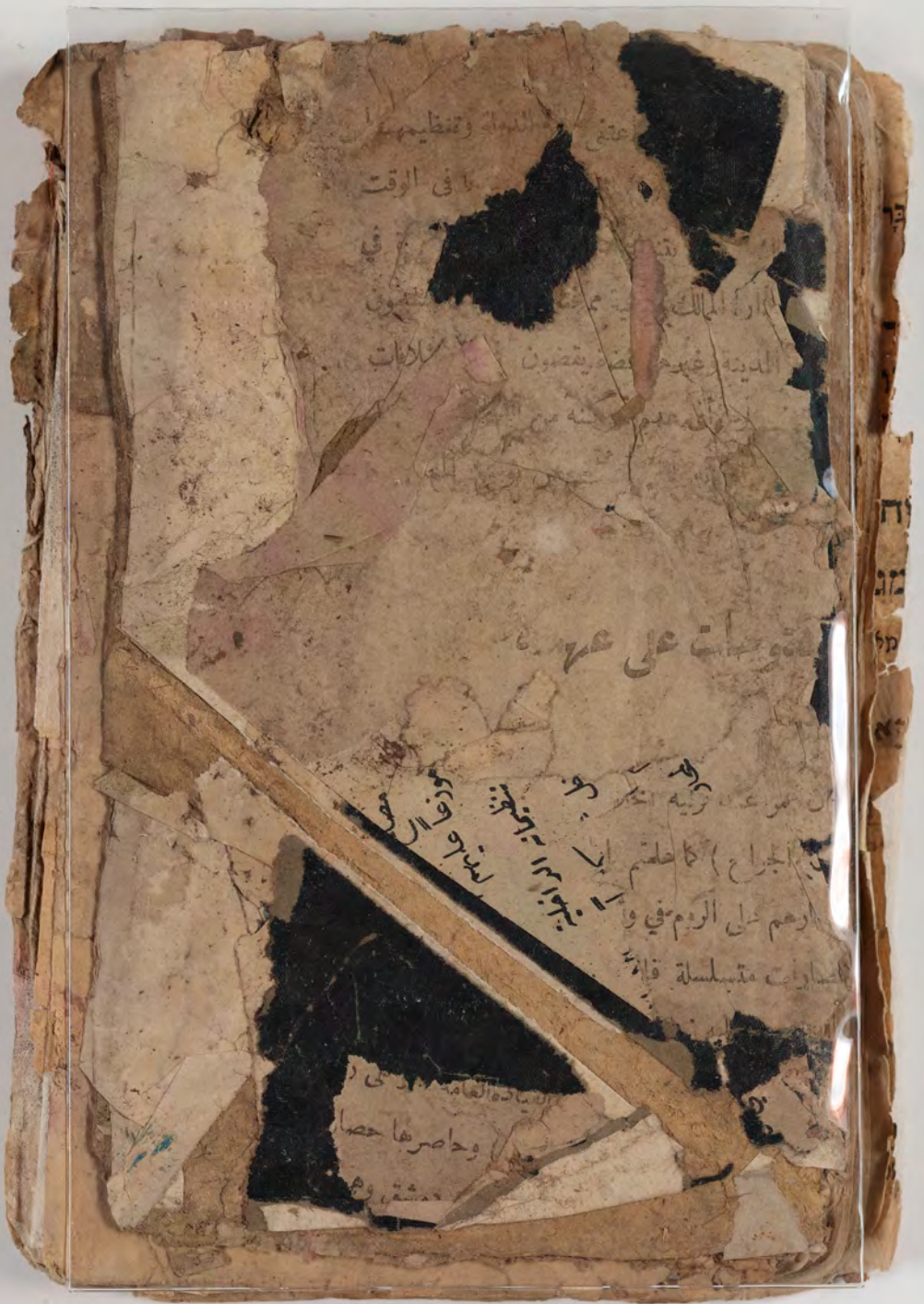
visible fragment from bookbinding