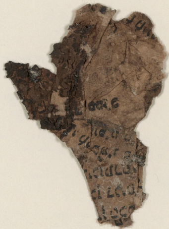
fragment/insert found with book

דִּים אֲנַחְנוּ לָךְ שְׂאֵתָה הוּא יְהוָה אֱלֹהֵינוּ וְאֵלֵהִי אֲבֹתֵינוּ לְעוֹלָם וָעֶד * צוּרנו צוּר חַיִּינוּ מִיָּמֵינוּ יִשְׁעֵנו אַתָּה הוּא לְדֹר וָדֹר נוֹדֶה לָךְ וְנִסְפָּר תְּהַלְלֶנּוּ עַל חַיֵּינוּ הַמְסוּרִים בְּיָדְךָ וְעַל נִשְׁמוֹתֵינוּ הַפְּקוּדוֹת לָךְ וְעַל נַסִּיךְ שְׂבָבֶל יוֹם עַמָּנוּ וְעַל נַפְלְאוֹתֶיךָ וְטוֹבוֹתֶיךָ שְׂבָבֶר יַעֲרַת * עֶרֶב וְקָר וְצַהֲרִים