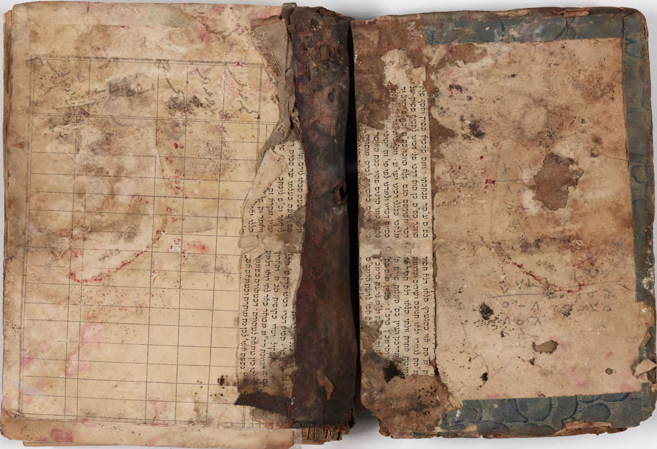
قطعة شظية مرئية من كتاب مجلدّ visible fragment from bookbinding