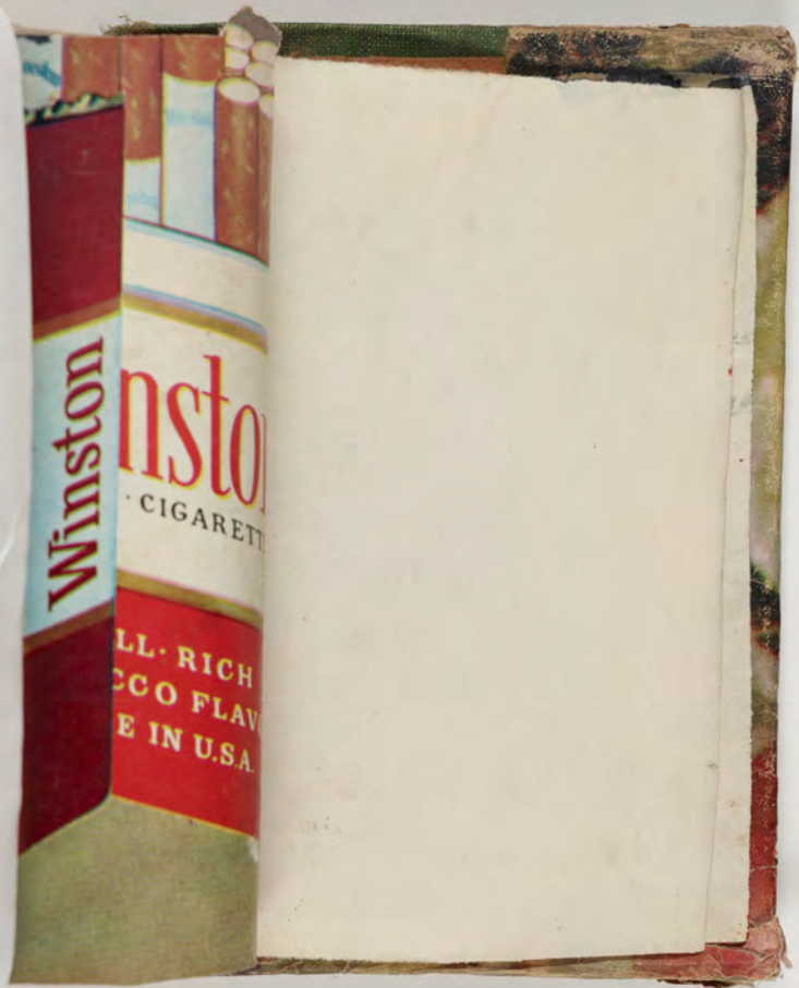
قطعة شظية مرثية من كتاب مجلدٌ visible fragment from bookbinding