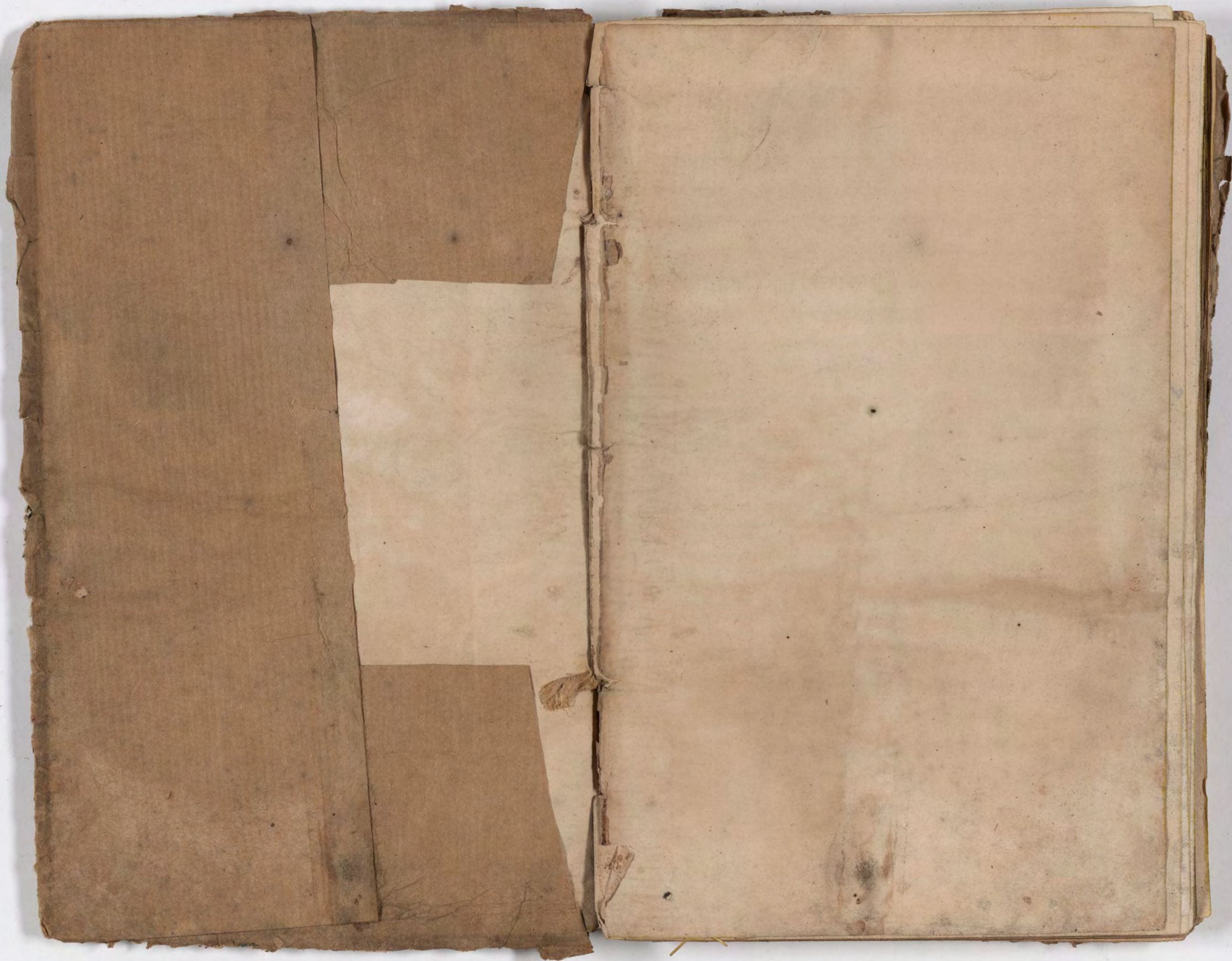
قطعة شظية / إدراج وجد(ت) مع كتاب fragment/insert found with book