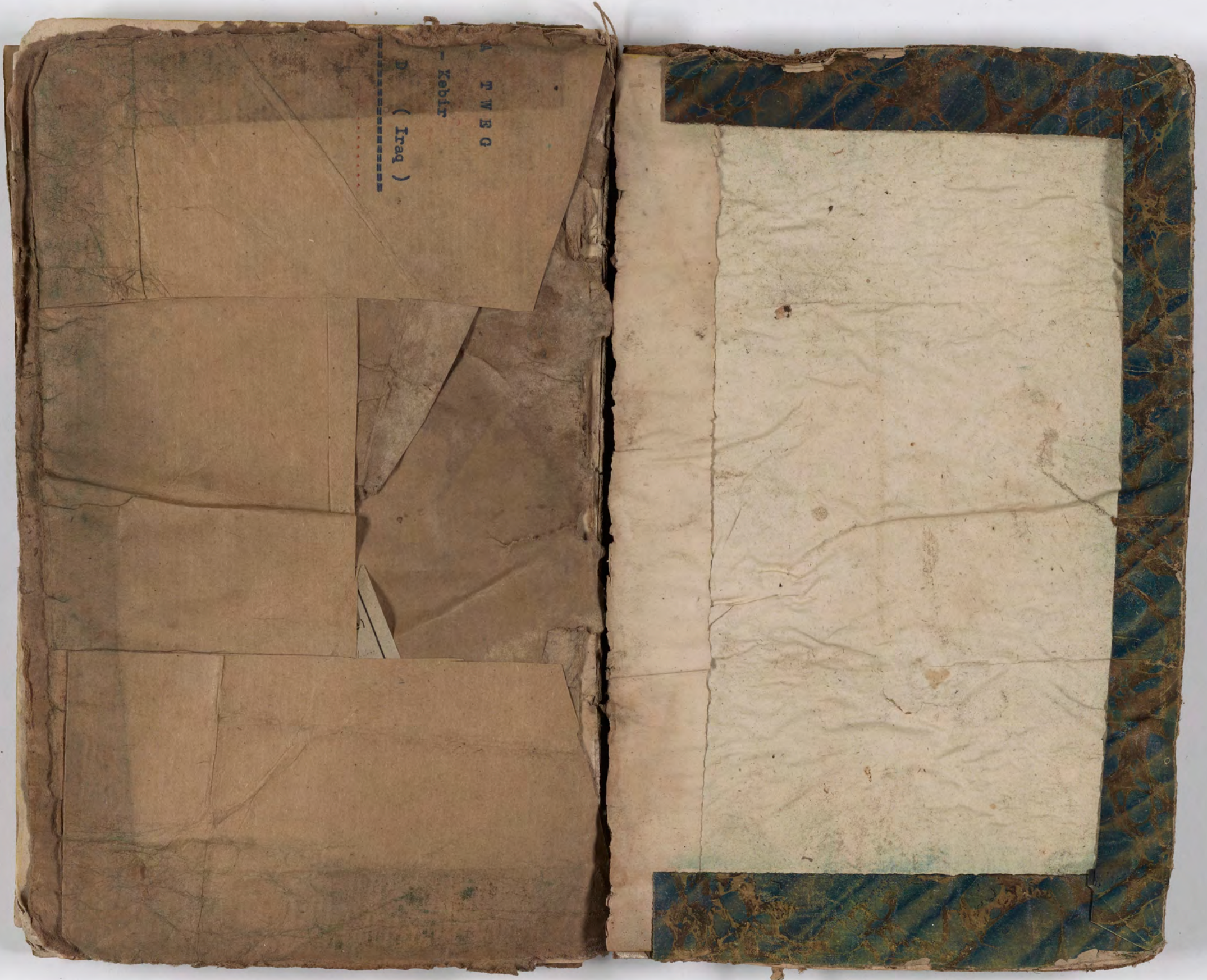
قطعة شظية مرئية من كتاب مجلدّ visible fragment from bookbinding