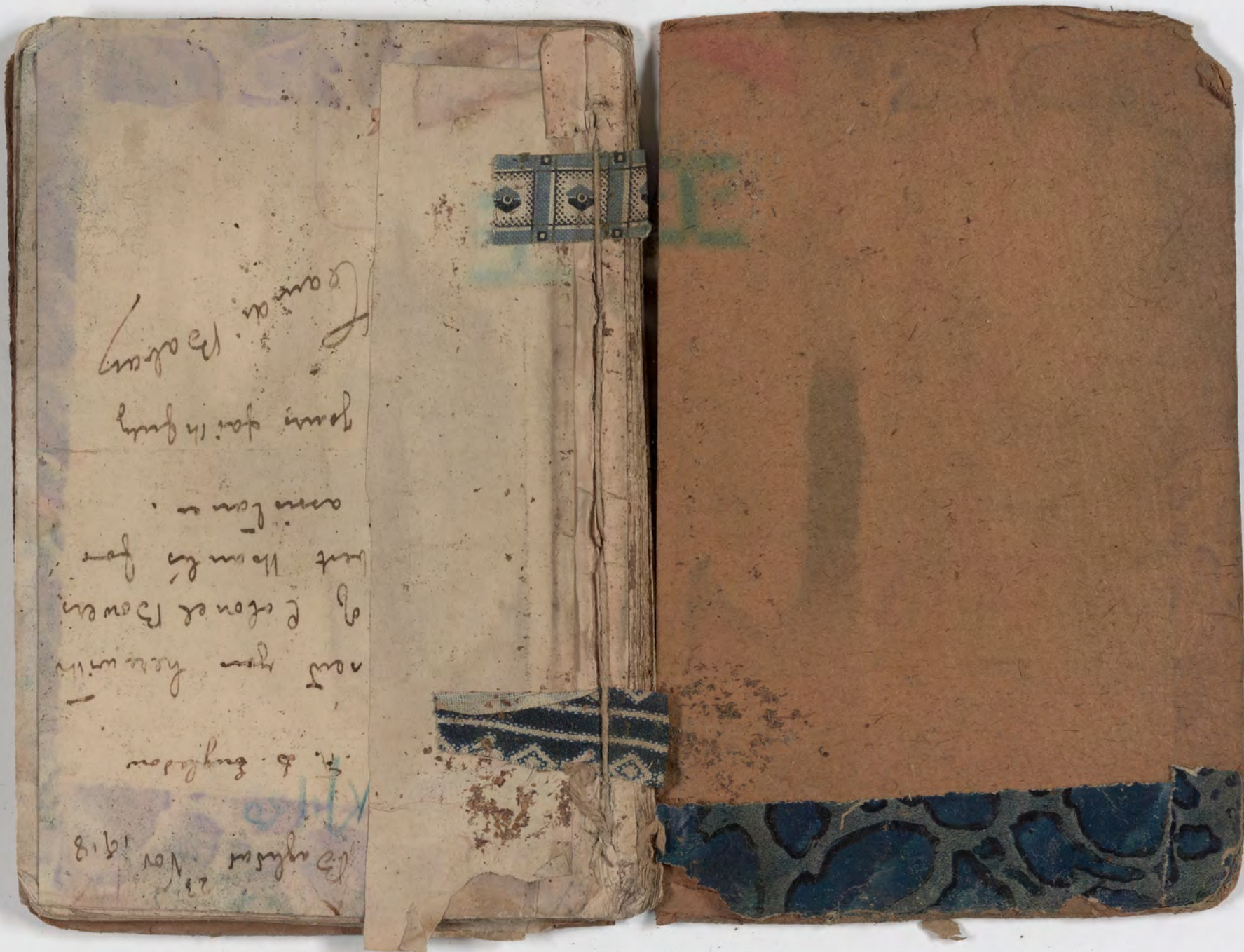
قطعة شظية مرئية من كتاب مجلد visible fragment from bookbinding