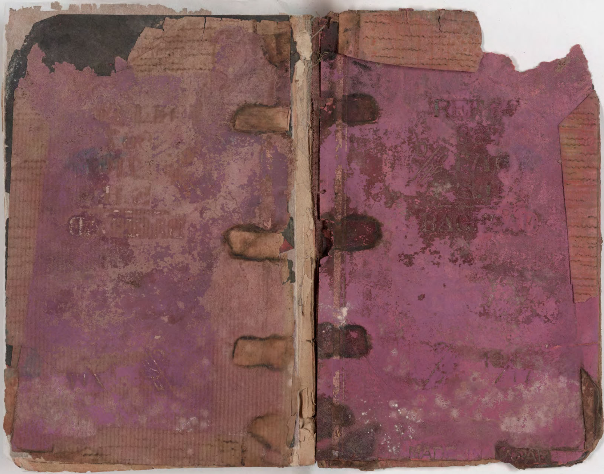
قطعة شظية مرئية من كتاب مجلدّ visible fragment from bookbinding