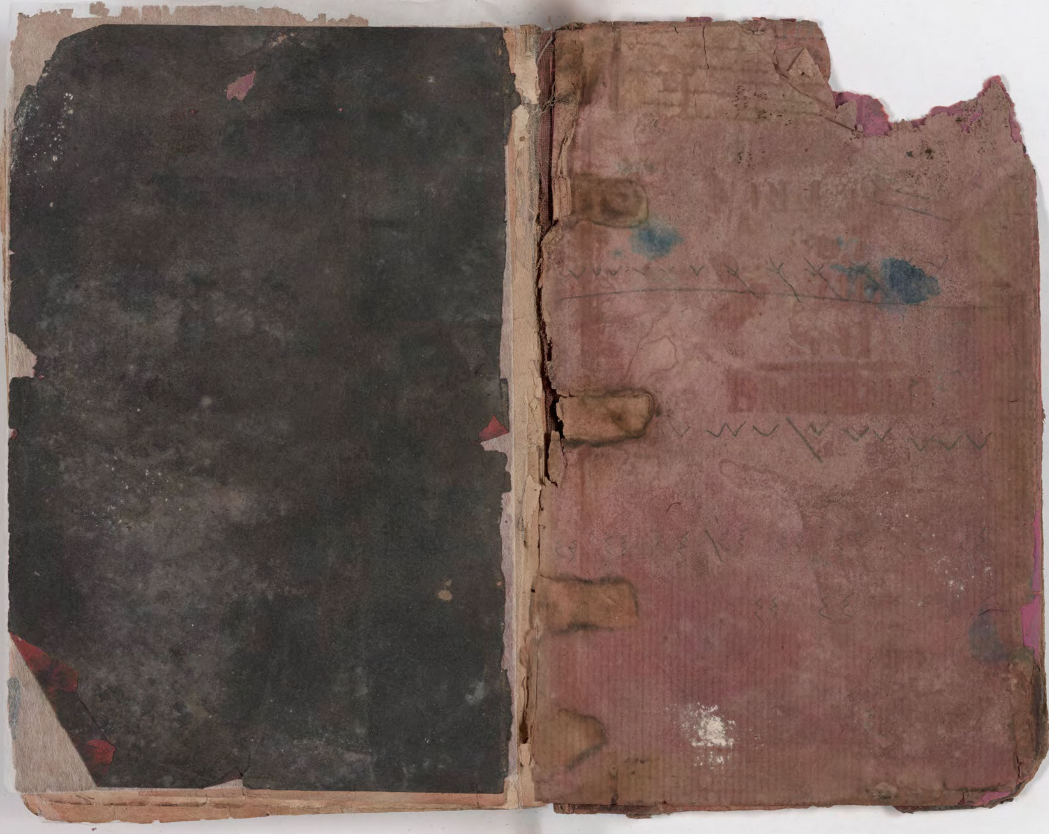
قطعة شظية مرئية من كتاب مجلدّ visible fragment from bookbinding