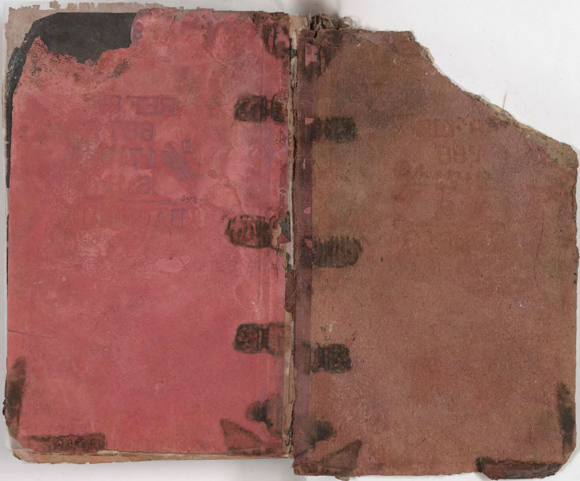
قطعة شظية مرئية من كتاب مجلدّ visible fragment from bookbinding